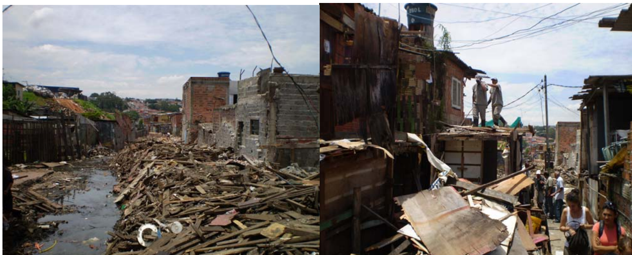
Foto 13 e 14 – Remoções com as destruição dos barracos na beira do Córrego das Águas Espriadas

umentar a permeabilidade do solo, além de lagos feitos a partir do represamento do Córrego Águas Espriadas, devem facilitar o escoamento da chuva na região.”