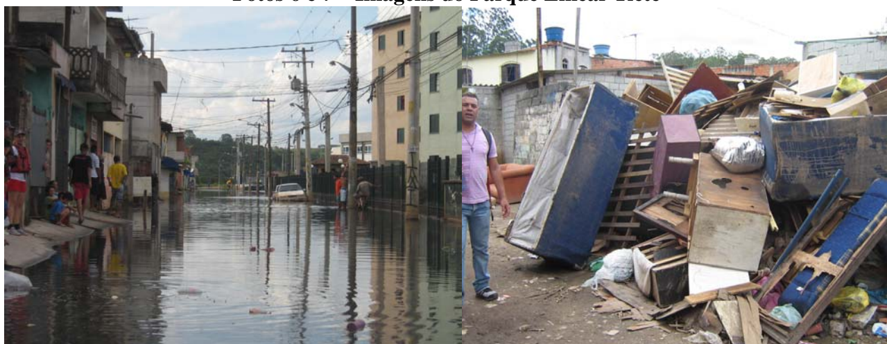
Foto 6 - Jardim Pantanal completamente inundado no dia da visita da Relatoria; Foto 7 - Móveis e objetos pessoais dos moradores que estavam dentro das moradias alagadas ficam no meio da rua

A Relatoria pode constatar ao visitar a comunidade da Chácara Três Meninas, o Jardim Pantanal e o jardim Romano que as comunidades da Várzea do rio Tietê estão constantemente sob sério risco de inundações por força das cheias do rio; estão em sérios riscos de contágio de doenças que se proliferam por causa dessas mesmas inundações e que não existe uma ação satisfatória dos poderes públicos, tanto estadual quanto municipal para a resolução emergencial desses problemas nem a médio prazo.