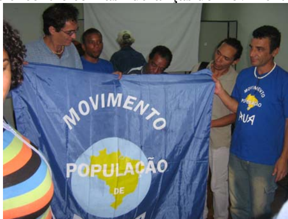
Foto 18 - Encontro do Relator Nacional do Direito à Cidade com Movimento de População de Rua