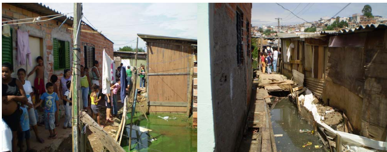
Foto 11 – Diversas crianças residem no local, convivendo com a situação de enchentes. Foto 12 – Casas em situação de enchente

A situação indica a necessidade de reassentamento imediato de parte das famílias de forma a garantir condições de habitação digna para as mesmas, o que pode ser realizado garantindo-se a