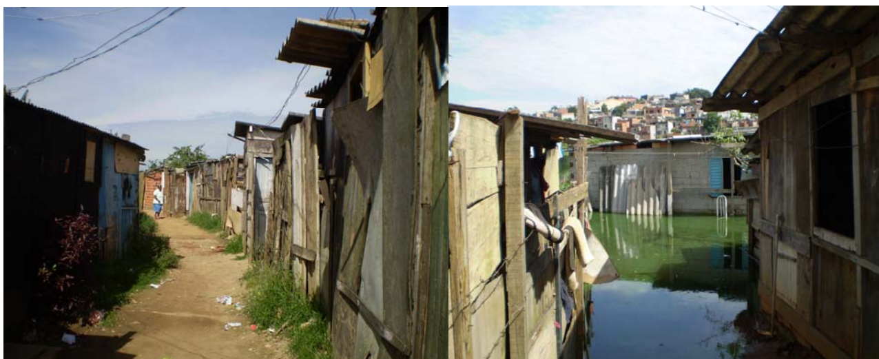
Foto 9 – Rua no Jardim Cocaia I, com várias casas de madeira; Foto 10 – Casas em situação de enchente (fotos tiradas pela Relatoria em 18 de dezembro de 2009)