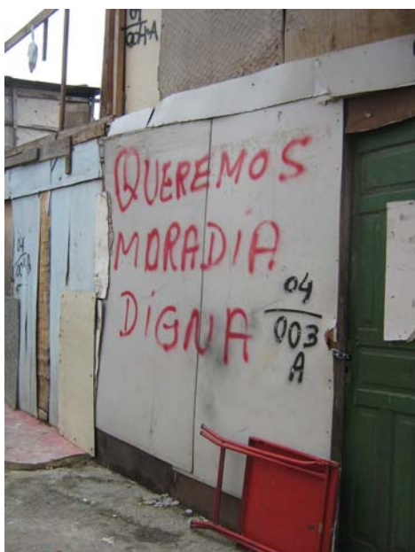
Foto 3 - Marcação de casa na Favela do Sapo realizada pelo Município de São Paulo.