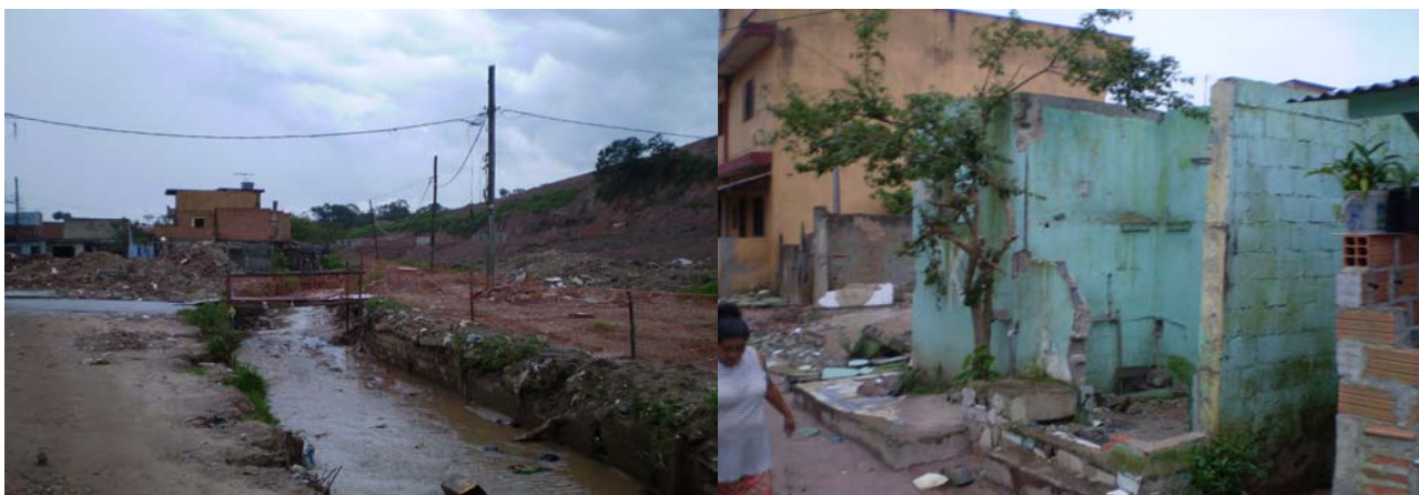
Foto 17 – As obras em execução, invadem o bairro; Foto 18 – Casas destruídas pelo Consórcio responsável pelas obras.