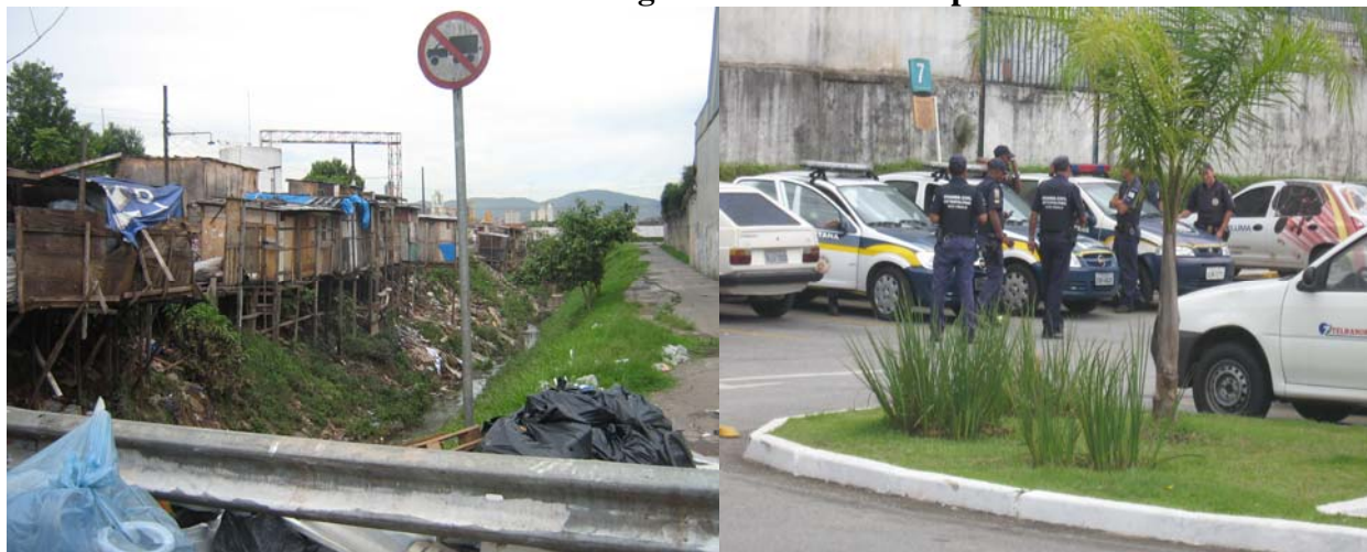
Foto 1 - Moradias em área de risco na favela do Sapo na cidade de São Paulo; Foto 2 - GCM – Guarda Civil Metropolitana de São Paulo suspendendo remoção de moradias na Favela do Sapo em virtude da visita da missão da Relatoria no local